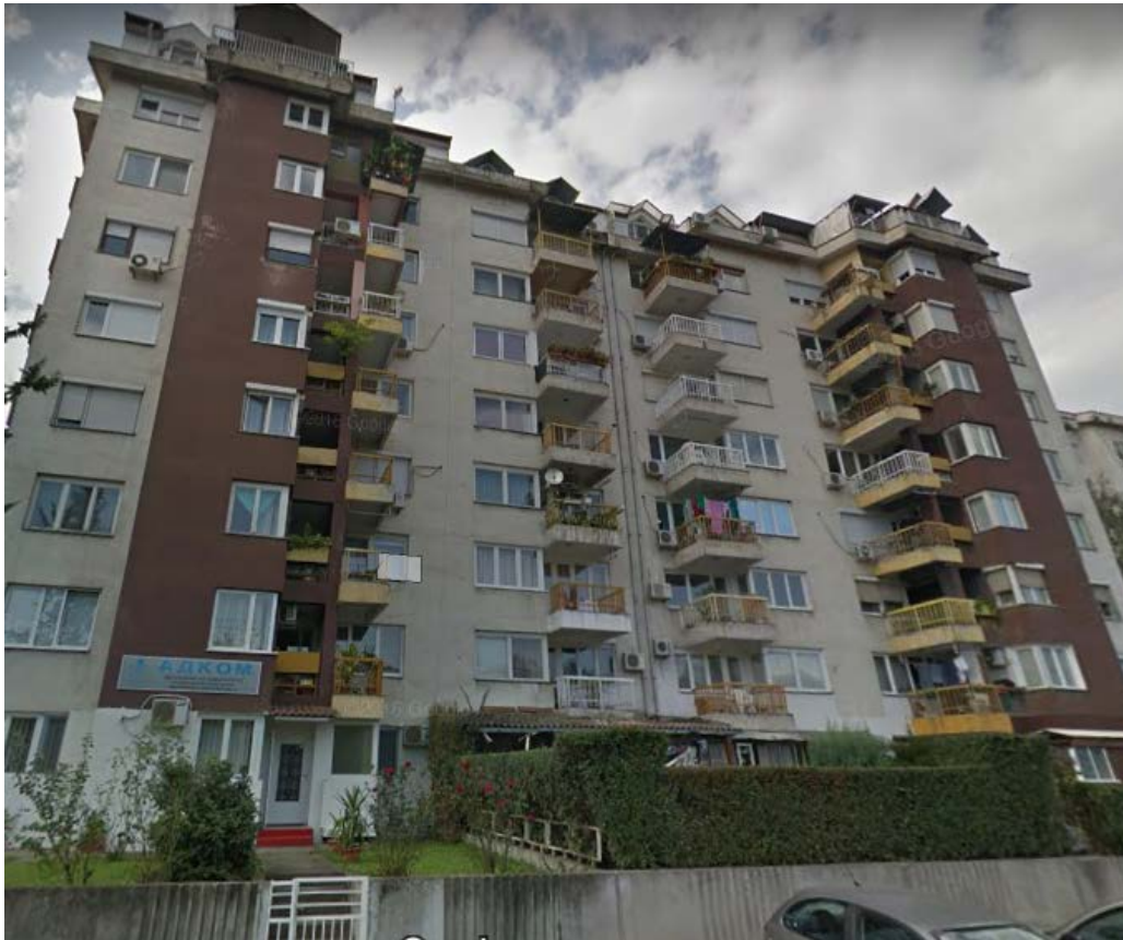
"Selia e ADKOM-it në Aerodrom të Shkupit"