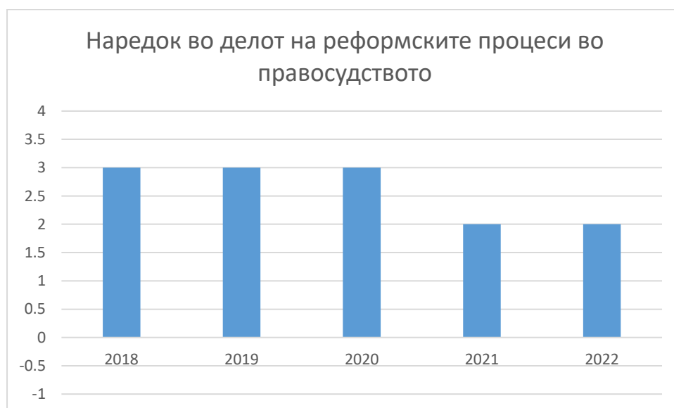
Табела 1. Табелата е направена согласно методологијата на Институтот за европска политика. Напредокот во реформските процеси се мери на скала од –1 до 4

Реформите во правосудството, исто како и минатогодишниот извештај 1 , бележат одреден напредок, за разлика од добриот напредок во спроведувањето на реформските процеси забележани во извештаите на Европската комисија (ЕК) за 2018 2 , 2019 3 и 2020 4 година. Ова се согледува и со имплементацијата на препораките дадени во претходните извештаи, пред сè извештајот од минатата година, кои во најголем дел се исти или видоизменети. Сепак, нивото на усогласеност останува непроменето од 2019 година, односно Северна Македонија има одредено/умерено напредното ниво на подготовка.