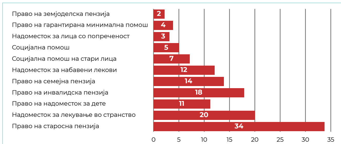
Графикон 1. Број на јавни расправи по основ

Во текот на извештајниов период (јануари-декември 2023 година), беа мониторирани вкупно 130 јавни расправи од областа на социјалните права. Како најзастапени основи кои беа расправани беа старосната пензија, надоместот за лекување во странство, надоместот за набавени лекови, семејната пензија и други. Сумарен приказ на најзастапените основи е прикажан во Графикон 1.