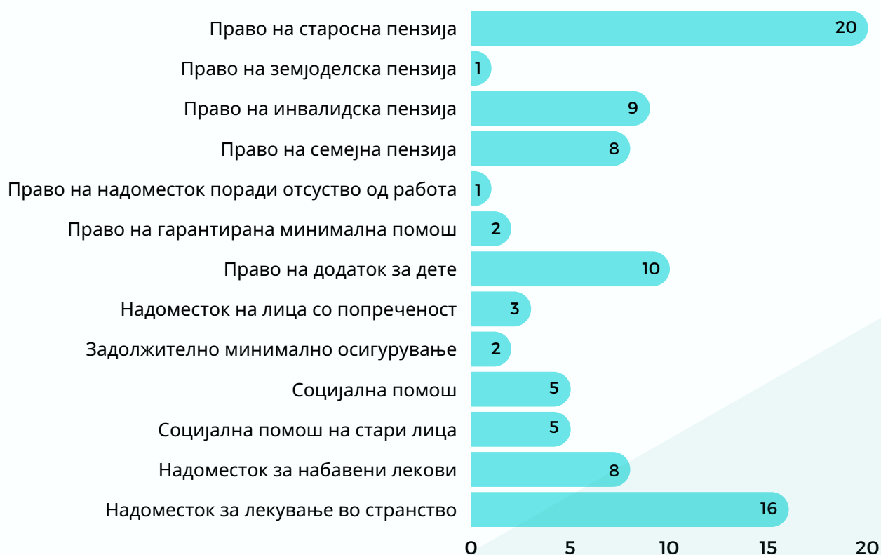
Графикон 1. Број на јавни расправи по основ

Во текот на овој извештаен период (јануари – јуни 2023 година), пред Управниот суд беа одржани 90 јавни расправи чиј основ се социјалните права. Како најзастапени тужени органи во овие расправи се Министерството за здравство и Министерството за труд и социјална политика. Во табела 1 е прикажан детален приказ за тоа кои основи биле расправани во овој извештаен период, и колку често се расправало за истиот основ.